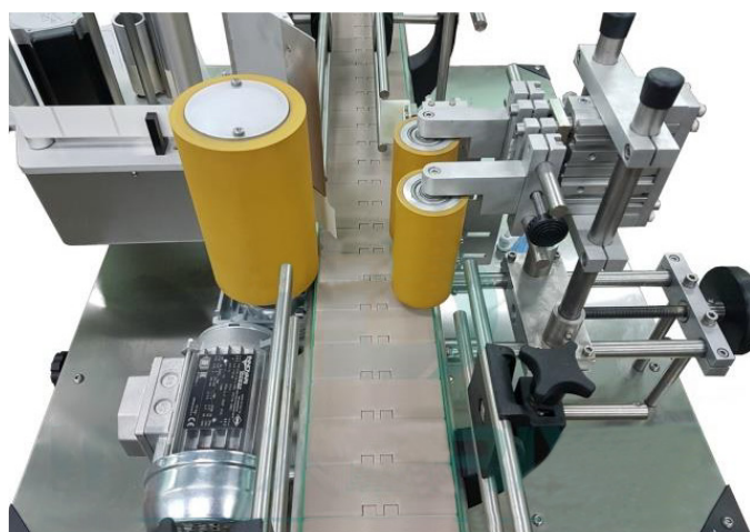
Узел наклейки этикеток привод прижимного валика