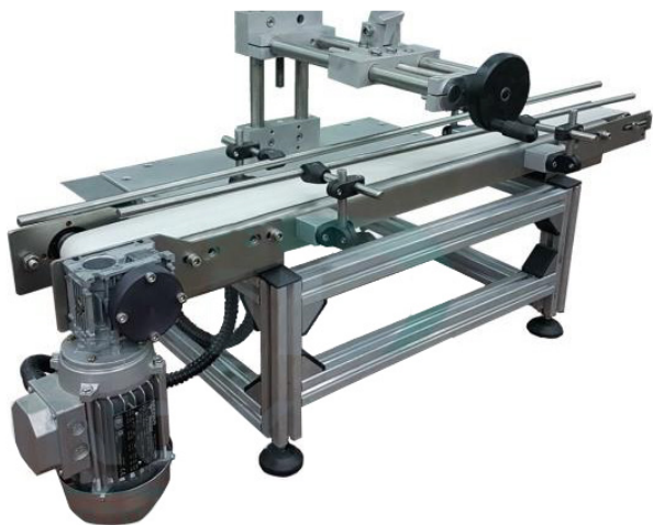
Привод конвейерной ленты